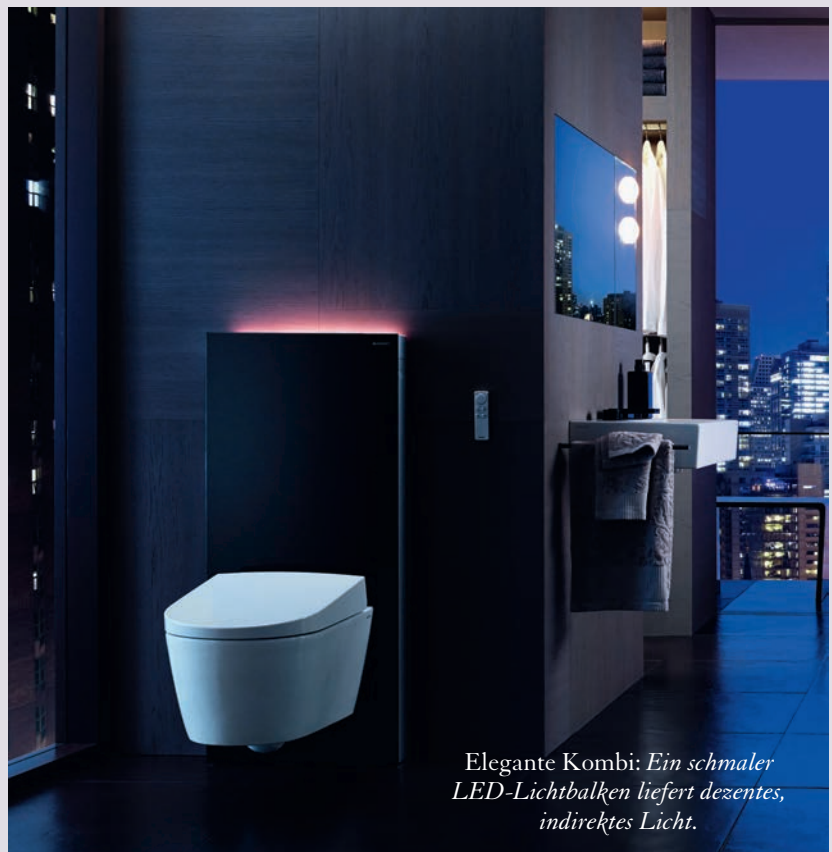
Elegante Kombi: Ein schmaler LED-Lichtbalken liefert dezentes, indirektes Licht.