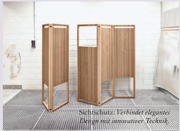
Sichtschutz: Verbindet elegantes Design mit innovativer Technik.

Die neue Möbelkollektion von Strasserthun ist erhältlich bei Roomdresser Zeltweg 4, 8032 Zürich, T 043 317 11 44 www.strasserthun.ch , www.roomdresser.ch